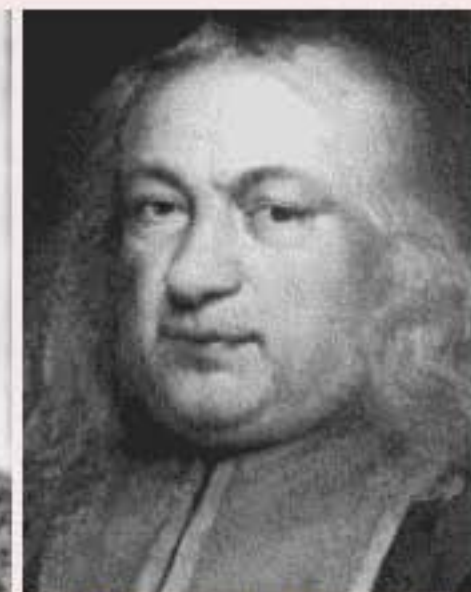
Pierre de Fermat