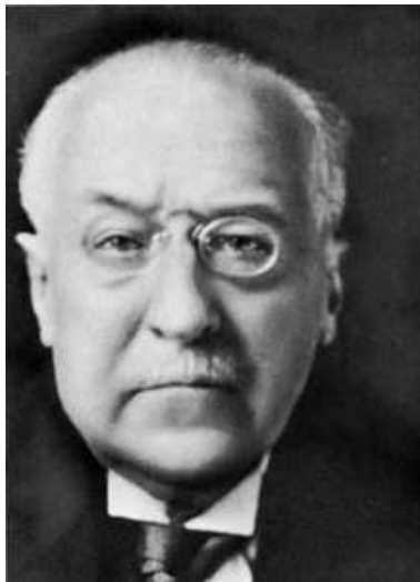
FIGURE 1 – Charles Émile Picard, 24 Juillet 1856 - 11 Décembre 1941