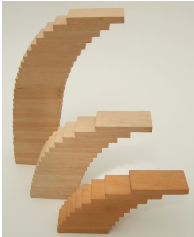
Piles de dominos, extraites du site « How round is your circle » par John Bryant et Chris Sangwin.

Dans l'exemple précédent, nous additionnons une infinité de termes, mais ceux-ci sont de plus en plus petits et tendent vers 0. Est-ce que cela suffit à faire que la somme soit finie? Regardons maintenant une pile de dominos (de longueur disons 2 unités) que nous penchons pour la faire avancer le plus possible. Le domino le plus haut, afin de ne pas tomber, ne doit pas être avancé de plus de 1. Si nous avançons de 1 le domino en-dessous, les deux dominos basculeront.